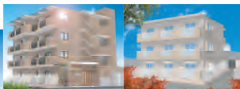
木月嵯峨野M 西大口田中M