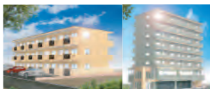
中曽根2丁目伊藤M 厚木旭町ビル